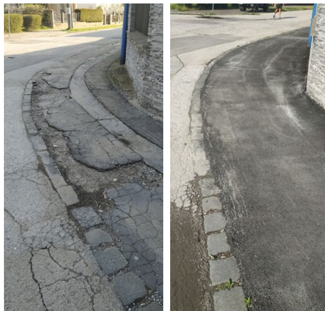
Stav pred a po oprave chodníkov.