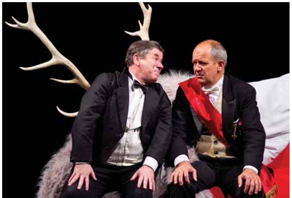
IVONA, PRINCEZNÁ BURGUNDSKÁ

VEĽKÚ NOC MNOHÍ VYUŽÍVAJÚ NA TURISTIKU ALEBO INÉ ŠPORTY. SEVER KOŠÍC JE ZNÁMY TÝM, ŽE MÁ NAJVIAC MOŽNOSTÍ NA ODDYCH AKTÍVNY AJ PASÍVNY. KTORÉ MIESTO NA SEVERE JE VÁM NAJBĽIŽŠIE A PREČO?